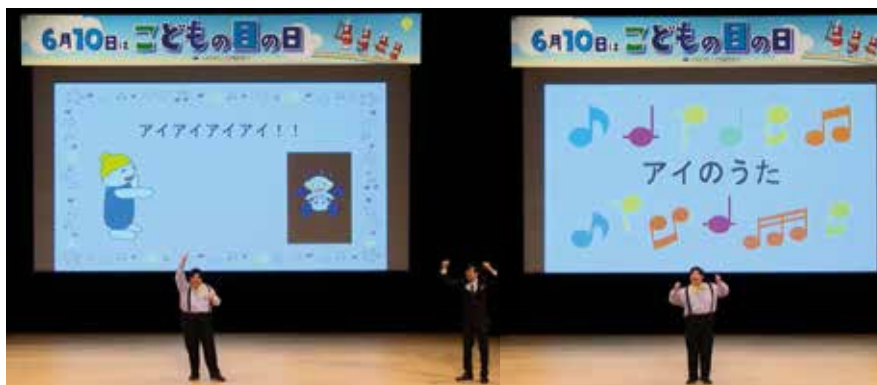
写真6 「アイのうた」を会場のみんと歌う様子