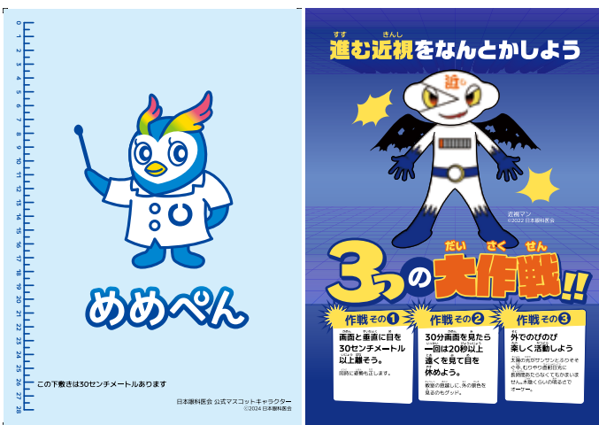
写真4 クイズで使用した下敷き