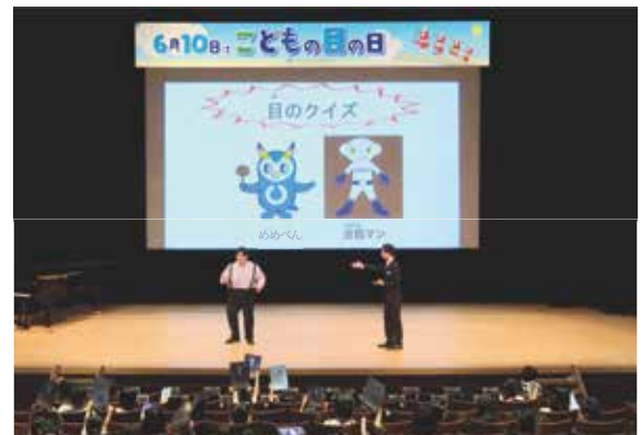
写真5 クイズに答える子どもたち