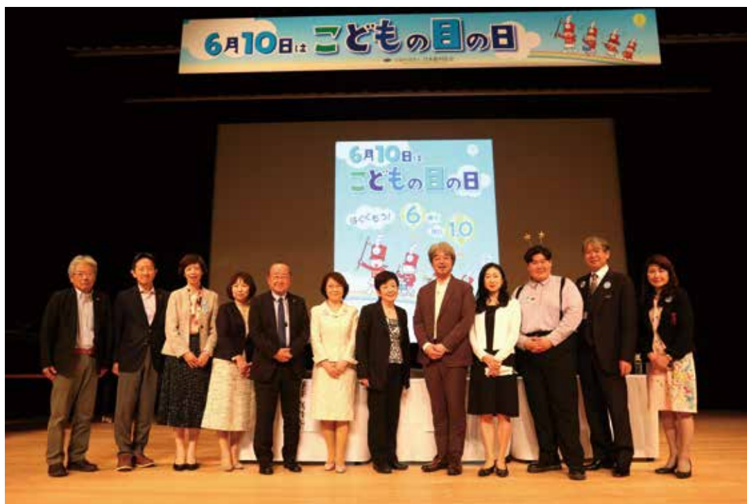
写真11 関係者集合写真

今回東京で本会がイベントを企画しましたが、6月30日に島根県で同様のイベントが行われており、地域ならではの取り組みや工夫などは今後他地域でのモデルケースとなると考えています。今年度の全国会長会議や全国眼科学校医連絡協議会などで紹介する場を設け、来年度以降各地区でこうした子どもの目に関する啓発イベントなどの取り組みが行われるきっかけになることを願っています(写真11)。